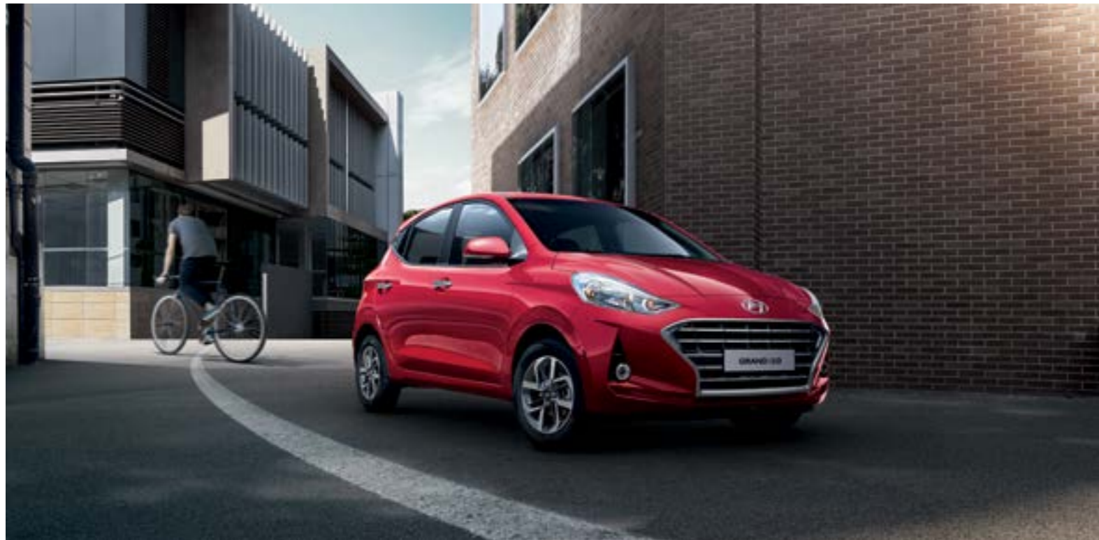
Tiên phong trong thiết kế với các đường nét thể thao, trẻ trung cùng mặt lưới tản nhiệt Crom tạo ra khí chất người dẫn đầu.