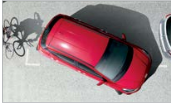
Cảm biến va chạm phía sau