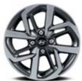
Vành hợp kim 15 inch cao cấp tạo hình trẻ trung