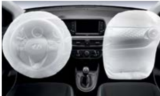
Hệ thống an toàn 2 túi khí