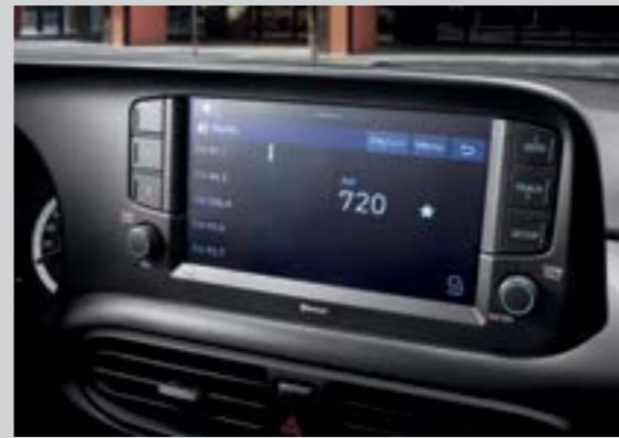
Màn hình giải trí 8 inch

Khoang nội thất của Grand i10 All New là tất cả những gì bạn cần. Đó là sự rộng rãi của không gian kết hợp cùng sự tỉ mỉ, tinh tế trên các chi tiết cùng các tiện ích vượt tầm phân khúc.