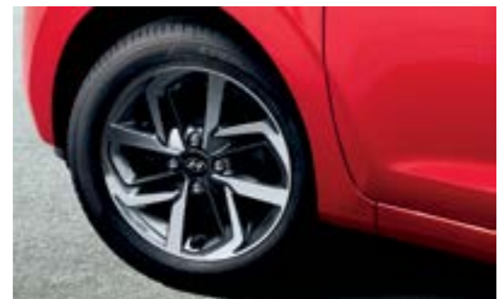
Hệ thống cảm biến áp suất lốp