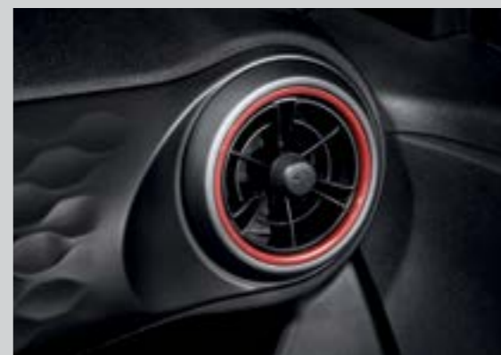
Cửa gió điều hòa dạng tua bin với 2 tông màu trẻ trung