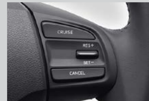
Điều khiển hành trình