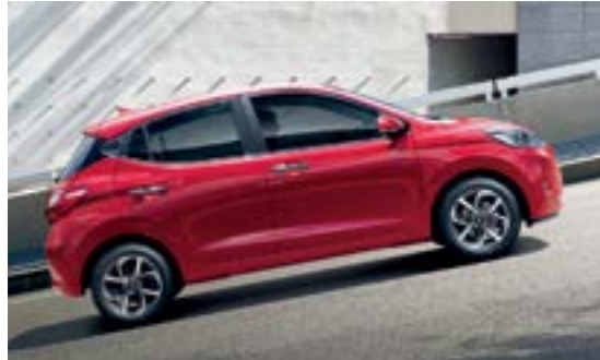
Hệ thống hỗ trợ khởi hành ngang dốc tích hợp với cân bằng điện tử