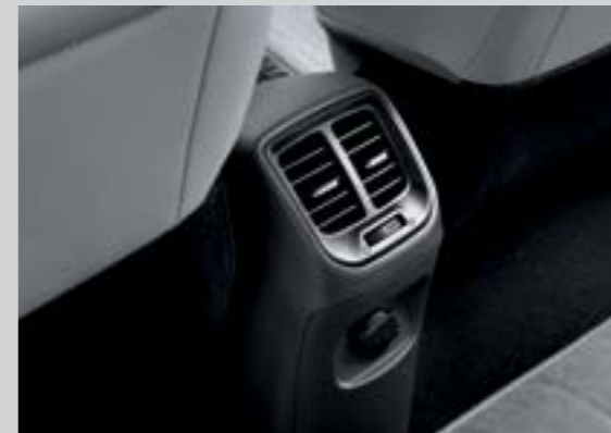
Cửa gió điều hòa hàng ghế thứ 2