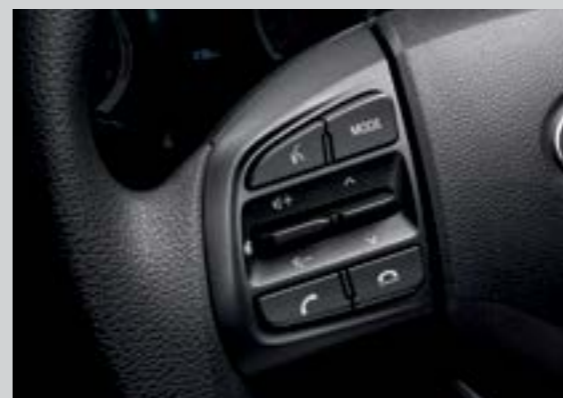
Cụm điều chỉnh media tích hợp nhận diện giọng nói