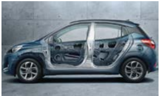
Hệ thống khung mới cứng vững hơn với thép cường độ cao AHSS