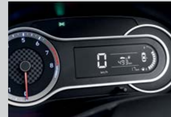
Màn hình thông tin thiết kế thể thao