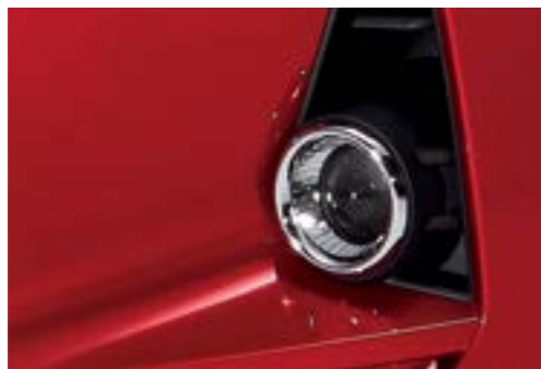
Đèn sương mù tích hợp trên cản trước thể thao