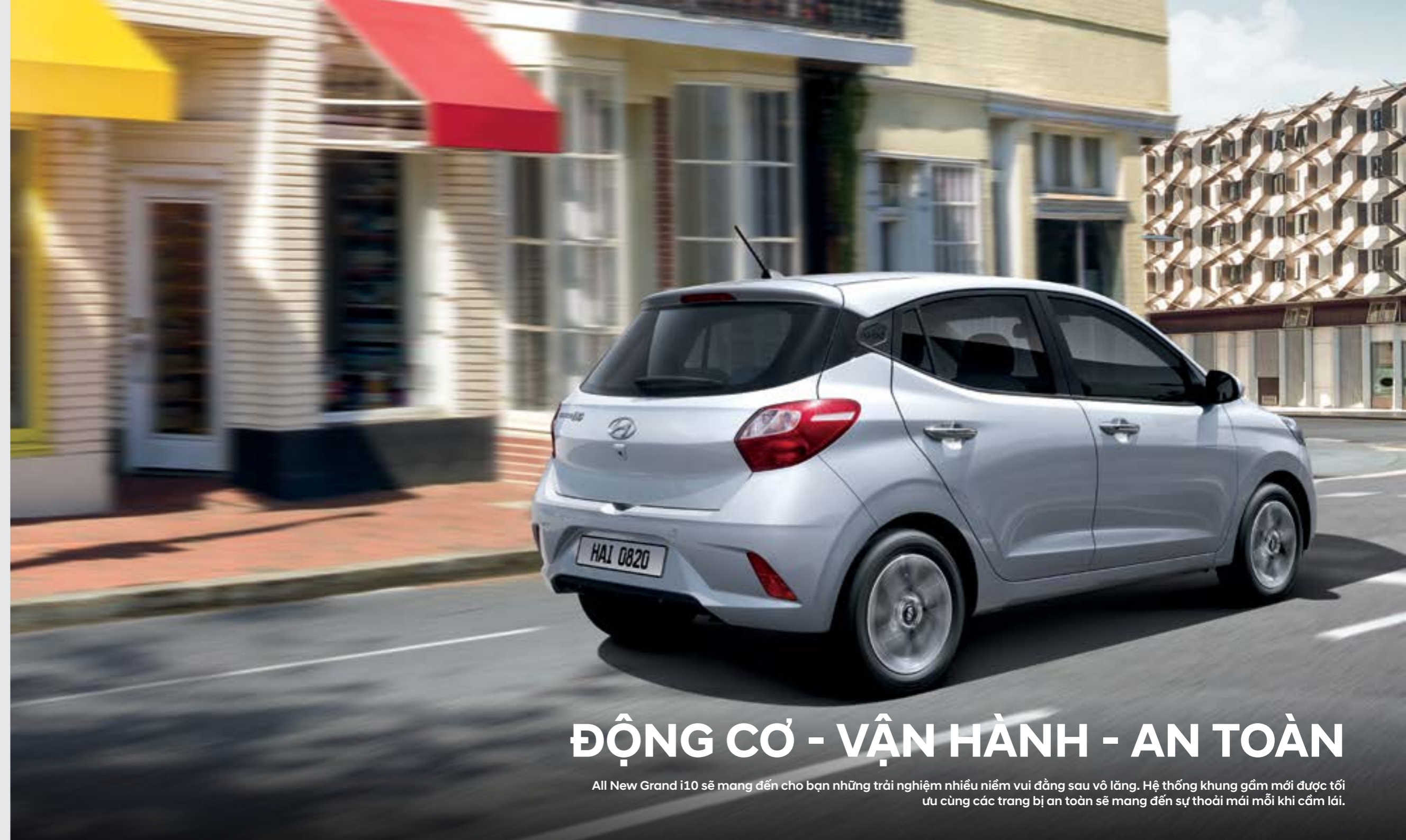
Được tối ưu để tạo nên sự cân bằng giữa niềm vui lái xe và khả năng tiết kiệm nhiên liệu