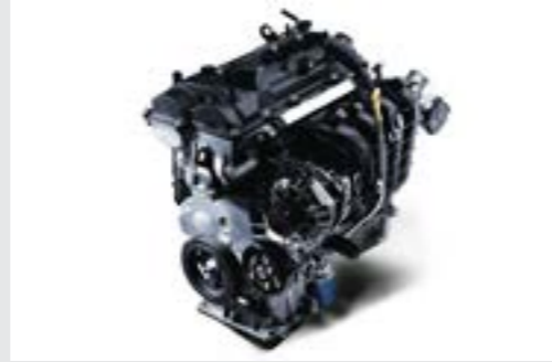
Động cơ Kappa 1.2L mang đến khả năng vận hành êm ái, ổn định cùng với khả năng tiết kiệm nhiên liệu nhưng vẫn đáp ứng được nhu cầu vận hành của khách hàng.