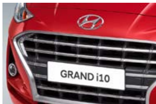
Cụm đèn ban ngày DRL (Daytime Running Light) được thiết kế phá cách dạng boomerang