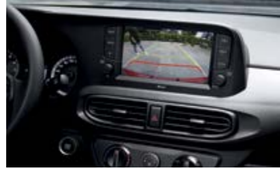
Camera lùi hỗ trợ đỗ xe